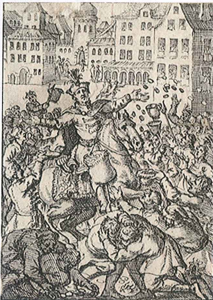
111. Koronázási zsetonokat szórnak a nép közé I. József 1687. évi pozsonyi koronázásán

Miként erről már szóltunk, a világi ceremónia négy részből állt: aransarkantyús lovagok avatása, királyi eskütétel, négy kardvágás, majd a sokat emlegetett koronázási lakoma. Ezek közül az esküt és a kardvágást mind a középkori Székesfehérvárott, mind a kora újkori Pozsonyban mindig