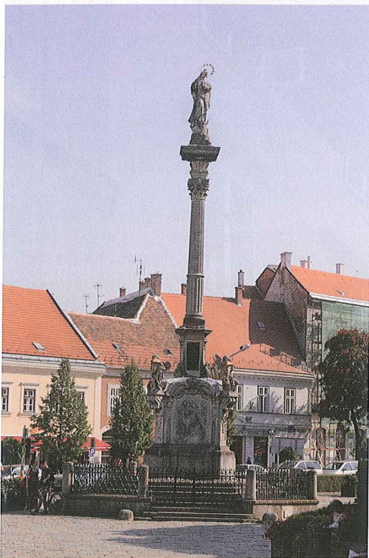
110. Várkerület, a Mária-oszlop környéke

a külvárosban tartották. Mivel a koronázásokon a régi hagyományok betartására a magyar politikai elit mindig gondosan ügyelt, így e két eseményt 1625 decemberében Sopronban is a városon kívül szervezték meg.